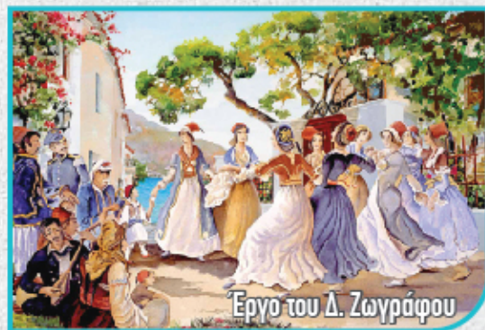
Έργο του Δ. Ζωγράφου

Κεράσματα για όλους από τον Σύνδεσμο Κρητών Ηρακλείου Αττικής